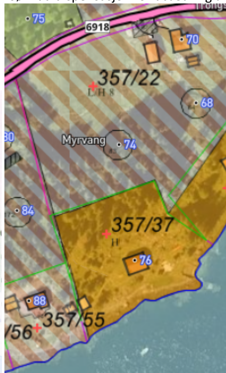
Utsnitt av Reguleringsplan for Trongsundet

I søknad om dispensasjon sies blant annet følgende: